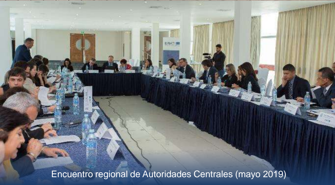
Encuentro regional de Autoridades Centrales (mayo 2019)

Latinoamérica y Europa contra los delitos medioambientales