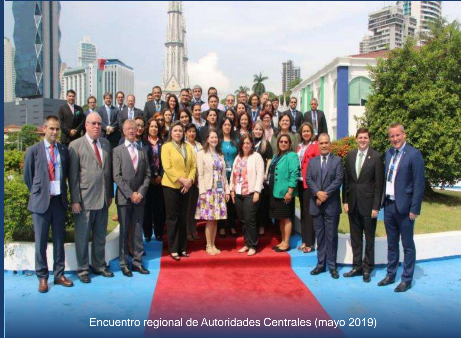
Encuentro regional de Autoridades Centrales (mayo 2019)