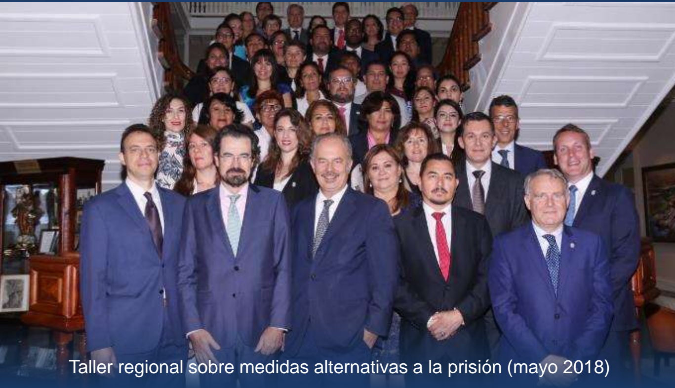
Taller regional sobre medidas alternativas a la prisión (mayo 2018)