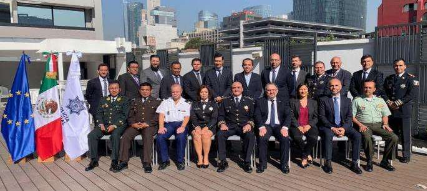
Inaugurado el Centro de Cooperación Policial Binacional de Paso Canoas

La UE y Latinoamérica avanzan hacia una cooperación jurídica internacional simplificada